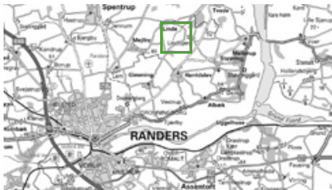
© Kort & Matrikelsyrelsen (G. 21-01)

Disse tiltag gennemføres for at sikre at det åbne landskab forbliver åbent med den mangfoldighed/biodiversitet, det giver i naturen.